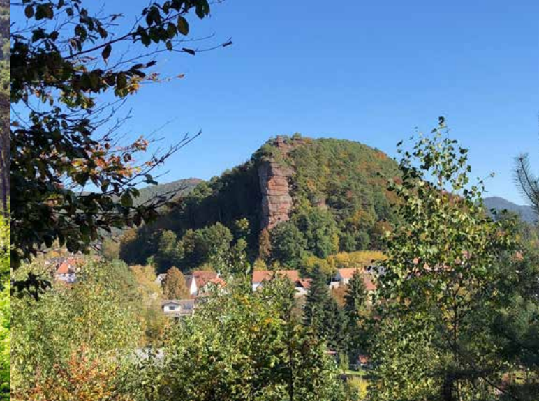
Blick auf den Jungfernsprung

Weiter führt die Route über den Wanderparkplatz bei der PWV-Hütte „Im Schneiderfeld“. Unterhalb des Elwetritschfelsens geht es bei leichter Steigung bergauf über den Otto-Eisel-Pfad zur Weihersebene. Bereits nach wenigen Gehminuten ist die Stille des Waldes wahrnehmbar. Durch geheimnisvollen Mischwald führt der schmale Pfad, vorbei an moosbewachsenen Steinen und Felsbrocken, zu einem