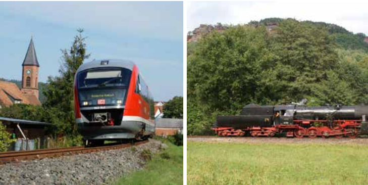
Bundenthaler und Wieslauterbahn (hier mit historischer Lok) unterwegs

freuen Sie sich auf neue Wandertouren, Veranstaltungstipps und die aktuellen Fahrpläne für den Bundenthaler und den Felsenland-Express . Von Mannheim haben Sie einen direkten Anschluss an den Bundenthaler, der innerhalb der Saison von Neustadt/Weinstraße nach Bundenthal-Rumbach fährt. Der Felsenland-Express bringt Sie von Karlsruhe (KVV-Tarif) nach Bundenthal-Rumbach. Viel Vergnügen und eine gute Fahrt!