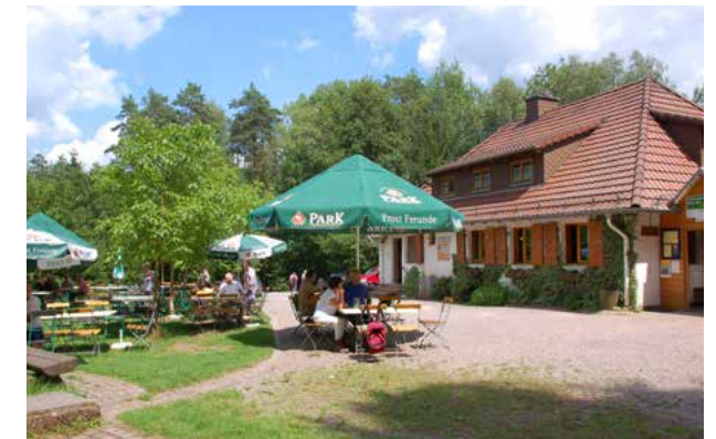
Dahner PWV-Hütte „Im Schneiderfeld“

Informationen zu den Einkehrmöglichkeiten finden Sie online in der Broschüre Erlebnisgastronomie unter www.dahner-felsenland.de und im Genusswegweiser Urlaubsregion Hauenstein unter www.urlaubsregion-hauenstein.de .