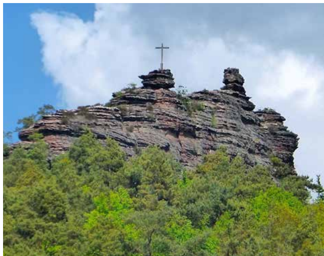
Blick auf die Fladensteine