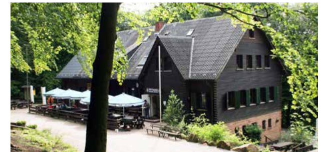
Wanderheim „Dicke Eiche“

Informationen zu allen Einkehrmöglichkeiten finden Sie in der neuen Broschüre Erlebnisgastonomie, erhältlich unter www.dahner-felsenland.de