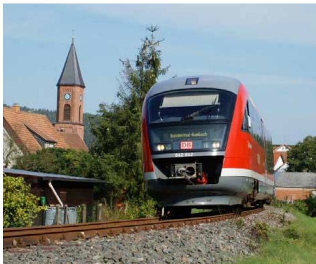
Der Bundenthaler bei Bruchweiler

VRN-Tarifauskünfte erhalten Sie unter der Service-Nummer 0621 / 1077 077 montags bis freitags von 8 bis 17 Uhr. Dort sowie unter www.vrn.de erhalten Sie rund um die Uhr Fahrplanauskünfte .