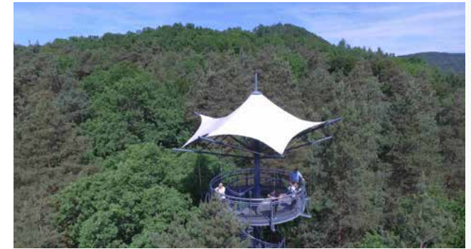
Drohne am Biosphärenhaus